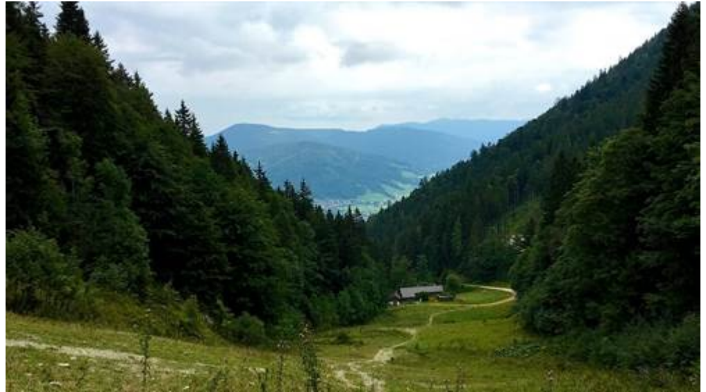
gesichertem Weg zum Staubfall. Direkt an der

Für Freitag mussten wir das Programm ändern, da witterungsbedingt beim Probewandern die Seilbahn noch nicht zu den Loferer Almen fuhr und alle Almen deswegen geschlossen hatten. Im nächsten Jahr holen